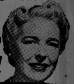
Tía Julia dice que ella nunca permite que el estreñimiento la agobie.

Si sufren de ESTREÑIMIENTO entérense de este mensaje!